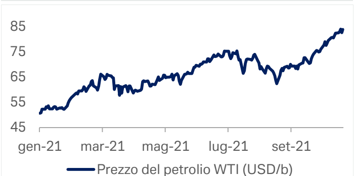
Grafico 2: Prezzi del greggio nel 2021

Fonte: Bloomberg Finance LP, Deutsche Bank AG. 22 ottobre 2021